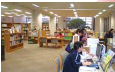
▲出入口付近からみた館内