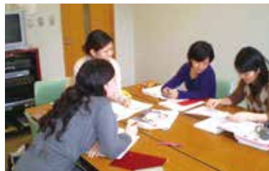
▲(グループ)学習研修室